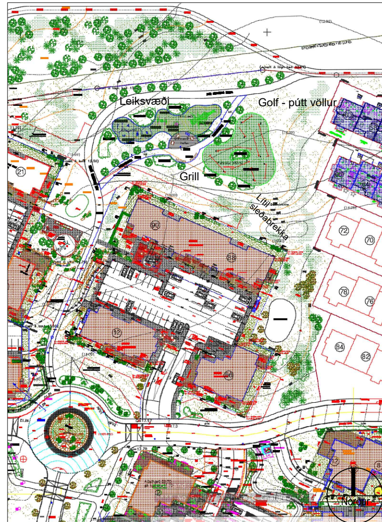
Skýringarmynd. Fyrirhugað leiksvæð. Hönnuður Pétur Jónsson landslagsarkitekt. í mkv. 1:1500