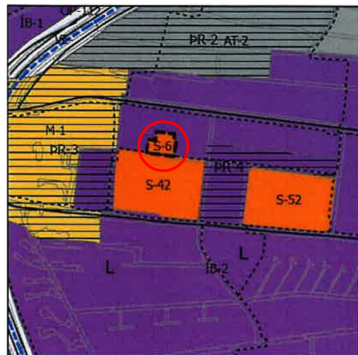
Aðalskipulag Kópavogs 2019-2040 m.s.br.

Deiliskipulagsuppdráttur A2 - 1:1000 Greinargerð A4 Umhverfismat deiliskipulags Minnisblað um umferðarmál