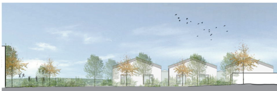
Skýringarmynd - norður ásynd leikskólans