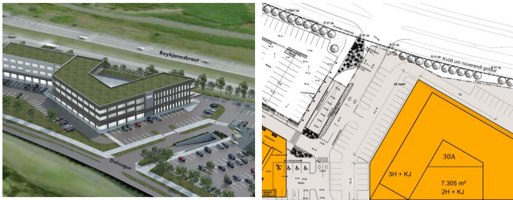
Mynd 2.1: Þrívíðarmynd frá ÍÞAKA fasteignafélag og ASK arkitektum til vinstri og afstöðumynd til hægri. Þrívíðarmyndin sýnir betri aðkomu að reit 30A, afstöðumyndina þyrfti að uppfæra til samræmis.

Skipulag umferðar innan lóðar er einfaldara en áður var. Göngu og hjólaleiðir eru betur skilgreindar en áður inn á þrívíðarteikningum frá arkitektum, en þess er saknað að þessar leiðir séu sýndar inn á afstöðumynd deiliskipulagsbreytingar. Líklegra er að byggt verði eftir afstöðumynd og því mikilvægt að sýna það sama þar og er sýnt á þrívíðarmyndum, svo hægt sé að meta aðkomu að lóðinni með réttum forsendum.