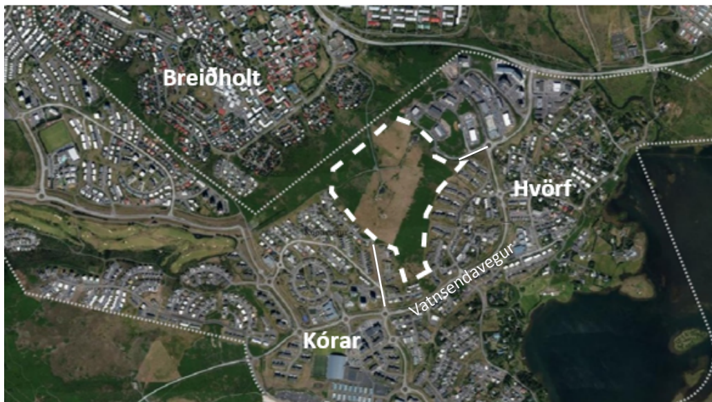
Mynd 3. Fyrirhugað nýtt íbúðarhverfi í Vatnsendahvarfi á Vatnsendahæð er afmarkað með hvítri punktalínu, loftmynd úr LUKK. Skýringarmynd, ekki í mælikvarða.

Svæðið sem fyrirhuguð breyting á aðalskipulagi nær til er í Vatnsendahvarfi á Vatnsendahæð en íbúðarhverfið liggur að fyrirhuguðum Arnarnesvegi til norðvesturs (á mörkum Kópavogs og Reykjavíkur), að íbúðarbyggð í Kórum til suðvesturs, fyrirhuguðu samfélagsþjónustusvæði (S-67) til suðurs, íbúðarbyggð í Hvörfum til austurs og athafnasvæði í Hvörfum til norðurs. Auk breytinga á umræddu svæði er gert ráð fyrir að skilgreining á tengibraut á Kambavegi að og frá hverfinu á tveimur stöðum verði felld niður.