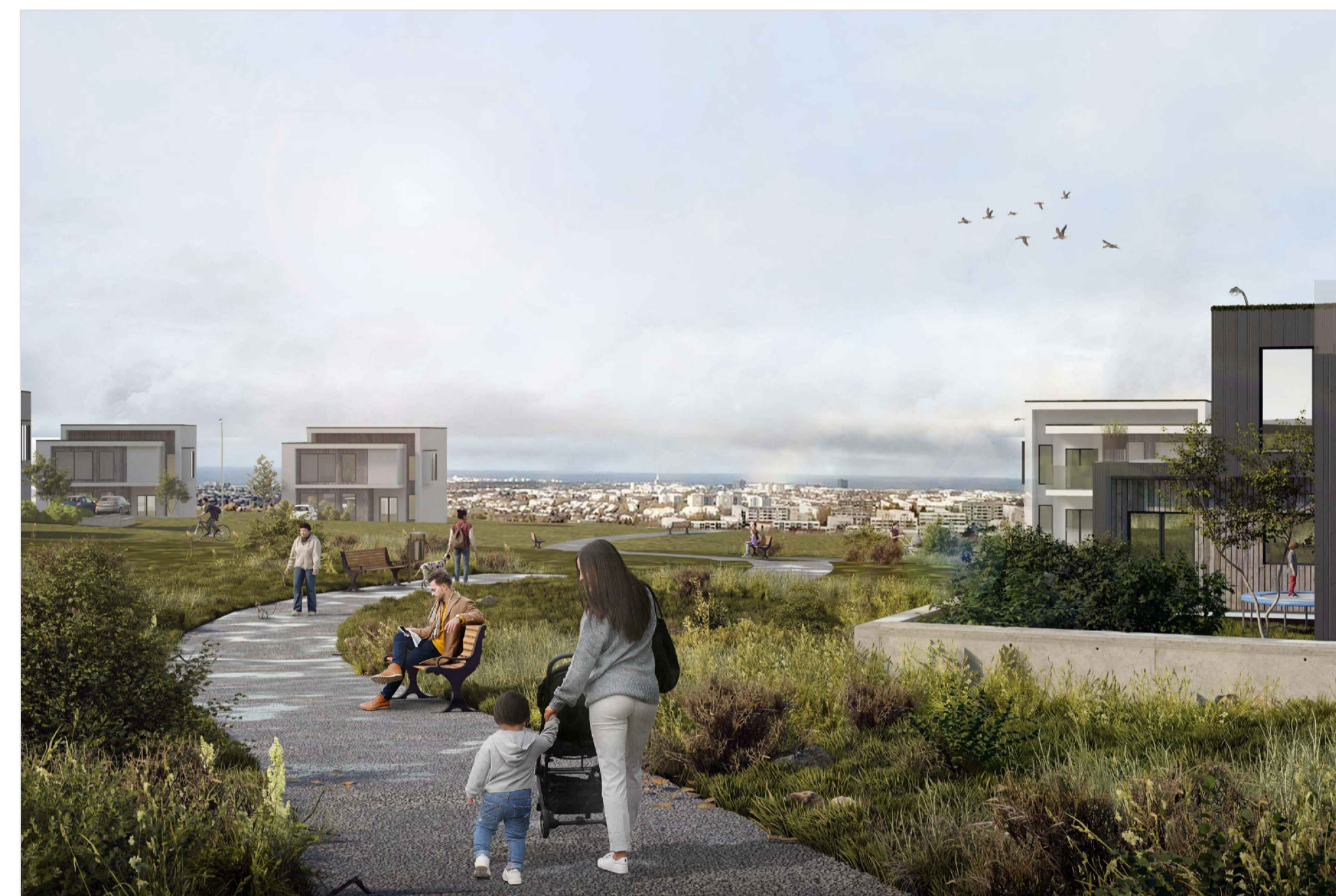
ÁSÝND YFIR GRÆNAN GEIRA