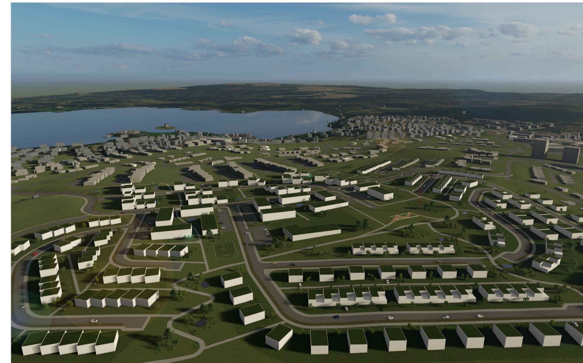
Yfirlitsmynd yfir byggð, horf til austurs í átt að Elliðaavatni.